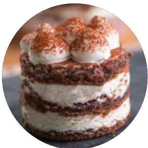
409. Tiramisú 4.95€