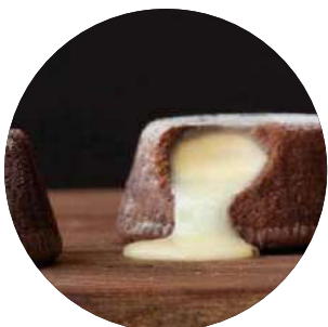
411. Souffle de chocolate blanco con helado 4.95€