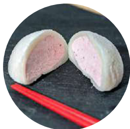
400.Mochi Fresa 3.95€