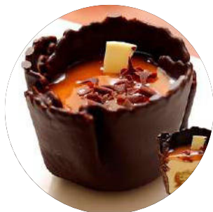
410. Crema vainilla café i baileys 4.95€