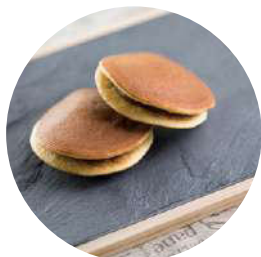
403.Dorayaki Chocolate(1u) 2.95€