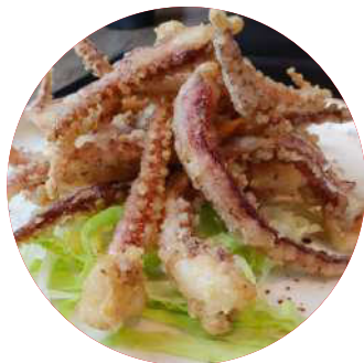
87 Tempura rejos Tempura rejos Rejos arrebossats en tempura