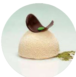
407.Coco amb cor te verd 4.95€