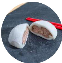
401.Mochi Chocolate 3.95€