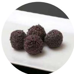
404.Trufes Chocolate 4.50€