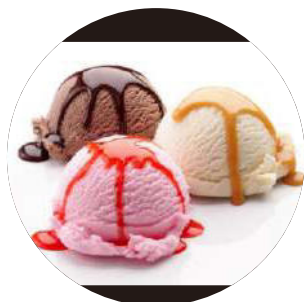
412. Bola de helado (Vainilla o Fresa o Té matcha) 3.00€