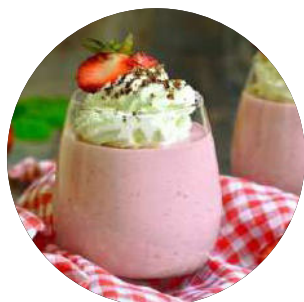
414. Mousse fresa 3.95€