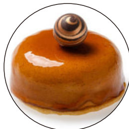
408.Porció rodona dulce de leche 5.95€