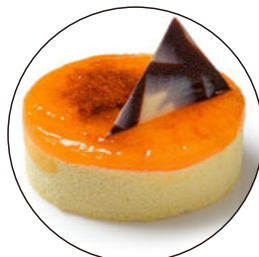
405. Crema catalana 5.95€