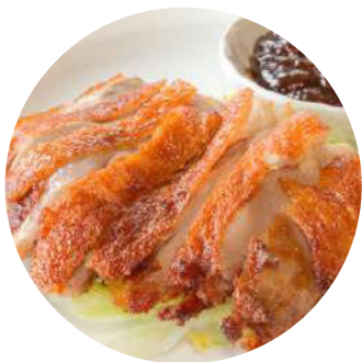
90 Pato asado Ànec rostit