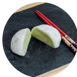
402.Mochi Té matcha 3.95€