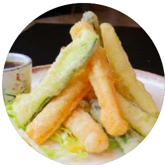
86 Tempura yasai Tempura yasai Tempura de verdure mixtes