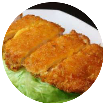
91 Tonkatsu chizu Tonkatsu chizu Empanada de llom farcit de formatge