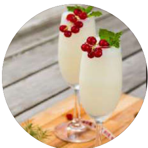
413. Sorbete de limón 3.50€