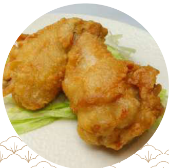
88 Kaarage alitas de pollo 2P Kaarage alitas de pollastre 2P Alitas de pollastre fregides