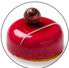
406.Cupula cereza cheesecake 5.95€