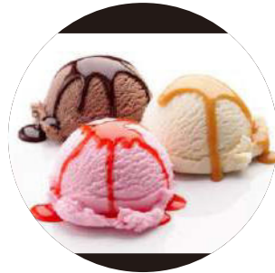
412. Bola de helado (Vainilla o Fresa o Té matcha) 3.00€