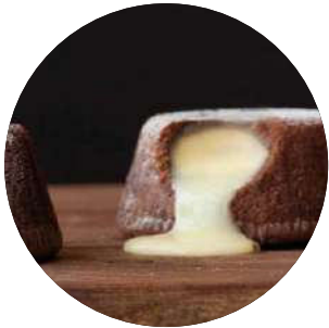
411. Souffle de chocolate blanco con helado 4.95€