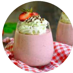
414. Mousse fresa 3.95€