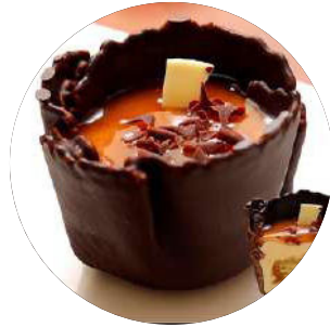
410. Crema vainilla café i baileys 4.95€