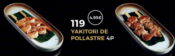
119 YAKITORI DE POLLASTRE 4P 4,95€ 120 KUSHIYAKI DE GAMBES 4P 4,95€