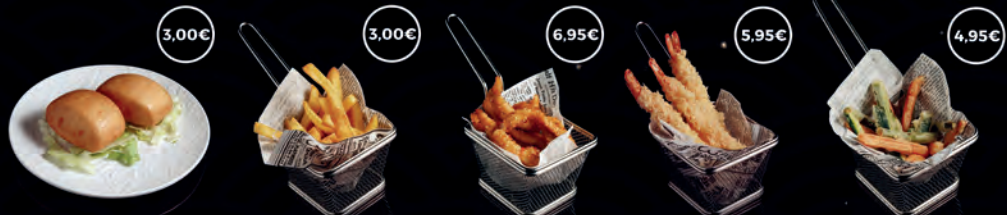
82 PA JAPONES 2P 3,00€ 83 PATATES FREGIDES 3,00€ 84 POLLASTRE A L'ESTIL JAPONÈS 6,95€ 85 EBI TEMPURA 5P 5,95€ 86 TEMPURA YASAI 4,95€