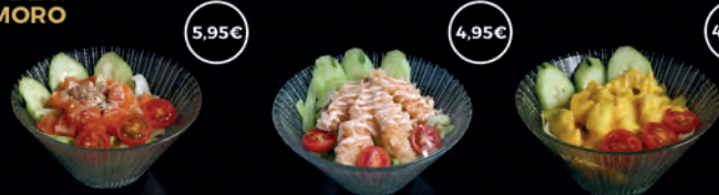
53 AMANIDA DE SALMÓ 5,95€ 54 AMANIDA EBI TEMPURA 4,95€ 55 AMANIDA YASAI 4,95€