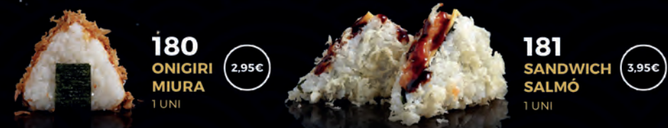
180 ONIGIRI MIURA 1 UNI 2,95€ Onigiri miura Arroz, salmón a la plancha, crema de queso, spicy mayo, cebolla crujiante y teriyaki Alérgenos: 3, 4, 6, 7 181 SANDWICH SALMÓ 1 UNI 3,95€ Sandwich salmon Tartar de salmón, crema de queso con tempura crujiante, queso cheddar y teriyaki Alérgenos: 1, 3, 4, 6, 7