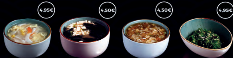
44 SOPA DE MARISC AMB BLAT DE MORO 4,95€ 45 SOPA MISO 4,50€ 46 SOPA AGRIPICANT 4,50€ 47 AMANIDA D'ALGA WAKAME 4,95€