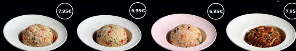
95 YAKIMESHI KAISEN 7,95€ 96 YAKIMESHI TRES DELICIAS 6,95€ 97 YAKIMESHI YASAI 6,95€ 98 YAKIMESHI DE LA CASA 7,95€