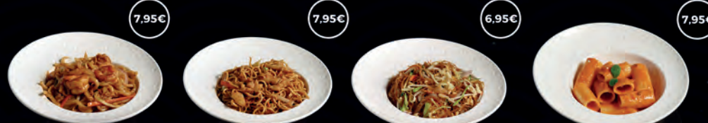
106 YAKI UDON AMB GAMBES 7,95€ 107 YAKISOBA AMB POLLASTRE 7,95€ 108 FIDEUS AMB VERDURES 6,95€ 110 RIGATONI ARRABBIATA 7,95€