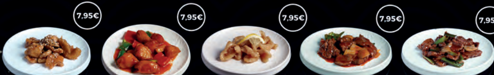
125 TORI TERIYAKI 7,95€ 126 KARAAGE DE POLLASTRE AGREDOLÇ 7,95€ 128 TORI LLIMONA 7,95€ 129 CYU PICANT 7,95€ 130 CYU AMB CEBA TENDRA 7,95€