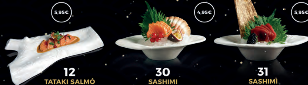
12 TATAKI SALMÓ 5,95€ 30 SASHIMI SALMÓ 4,95€ 31 SASHIMI TONYINA 5,95€