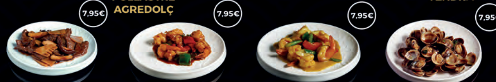
131 CYU AMB BAMBÚ I BOLETS SHIITAKE 7,95€ 132 EBI PICANT 7,95€ 133 EBI CURRI THAI I COCO 7,95€ 135 CLOÏSSA AMB SALSAS ESPECIAL 7,95€