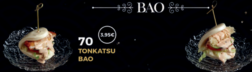
70 TONKATSU BAO 3,95€ 71 EBI BAO 3,95€