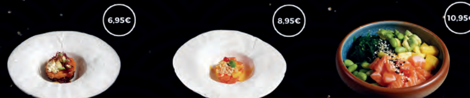
39 SALMÓ BLACK CAKE 6,95€ 40 TARTAR MANGO SHAKE 8,95€ 142 POKE SALMÓ 10,95€