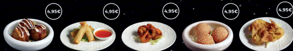
75 TAKOYAKI 5P 4,95€ 76 HARUMAKI YASAI 4,95€ 78 EBI FURAI AMB SÈSAM 5P 4,95€ 79 BOLES DE SÈSAM 5P 4,95€ 80 WANTUN FREGIT 5P 4,95€