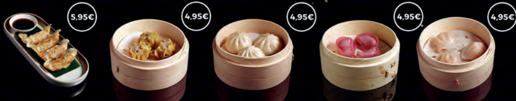
60 GYOZA A LA PLANXA 6P 5,95€ 61 SAUMAI 4P 4,95€ 62 XIAOLONGBAO 4P 4,95€ 63 GYOZAS DE VEDELLA 4P 4,95€ 64 GYOZA DE LLAGOSTÍ 4P 4,95€