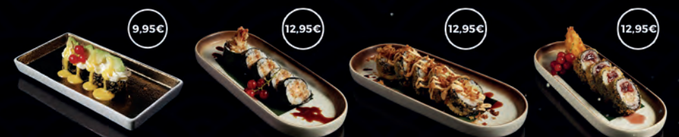
184 HOSOAGUACATE 8P 9,95€ 191 FUTO EBITEN 10P 12,95€ 192 FUTO CRUNCHY TEMPURA 10P 12,95€ 193 FUTO PERA PORTO 10P 12,95€